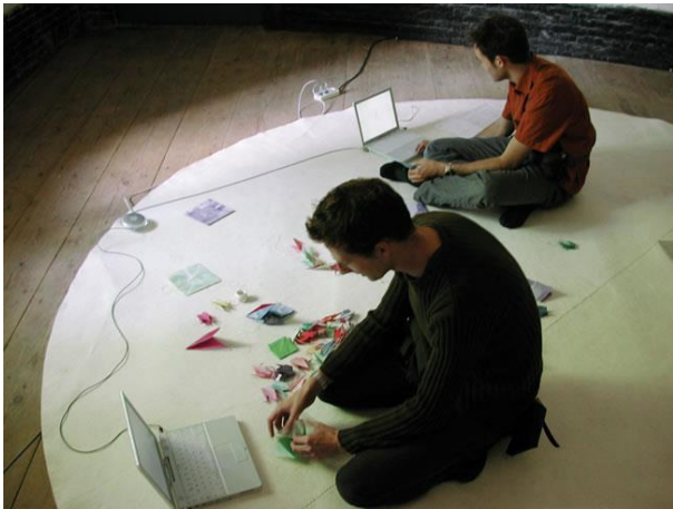
Marie-Ange Guilleminot, Le Salon de transformation blanc , 1999, collection du FNAC