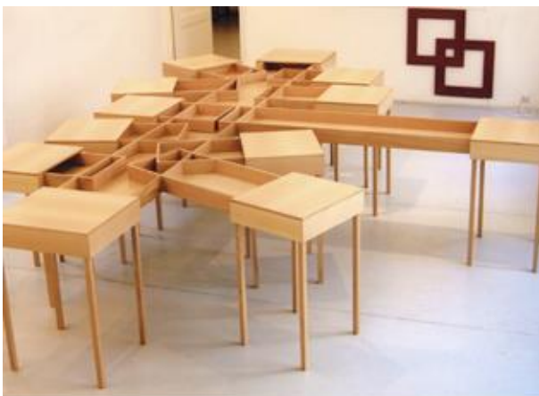
Nathalie Elémento, Le grand Banquet , 2000, collection du FNAC